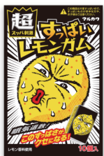
すっぱいレモンガム