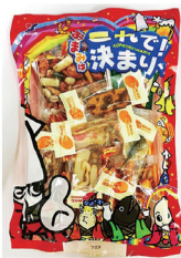
おつまみはこれで決まり