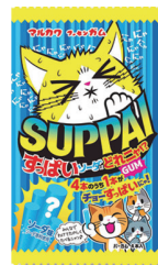
すっぱいソーダはどれニヤガム