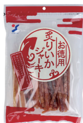
お徳用炙りいかジャーキー