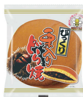
びっくり栗入りどら焼き