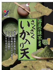
西尾の抹茶使用 さくさくいか入り天