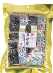
特大 大粒焼帆立貝