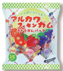
テトラガムパック