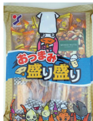
おつまみ盛り盛り