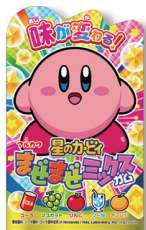
星のカービィまぜまぜミックスガム