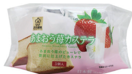
あまおう苺カステラ