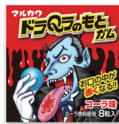
ドラQラのもとガム