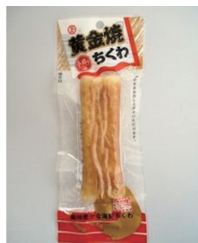
黄金焼ちくわ(鯛入)