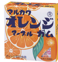
ビックサイズオレンジマールガム