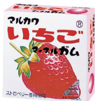
ビックサイズいちごマールガム