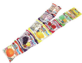
10連あべっ子ラムネ