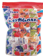
フーセンガムバラエティー