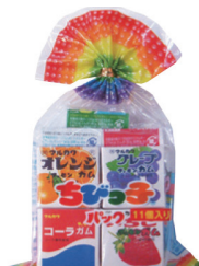
ちびっ子パックフーズンガム