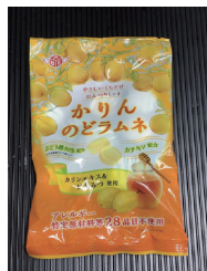
かりんのどラムネ