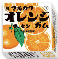
オレンジフーセンガム