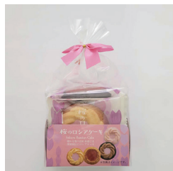
桜のロシアケーキ