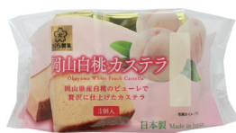
岡山白桃カステラ