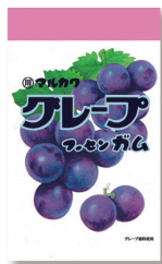
チャック袋グレープフーズンガム