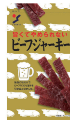
ビーフジャーキー