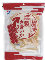
お徳用燻製さきいか