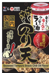
さくさくのり天 桃屋の食べる ラー油味