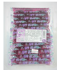
グレープこんにゃくゼリー