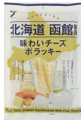
味わいチーズポラッキー大袋