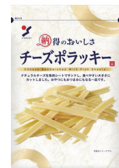
チーズポラッキー