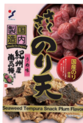
さくさくのり天 うめ味