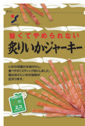
炙りいかジャーキー