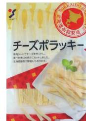
チーズポラッキー