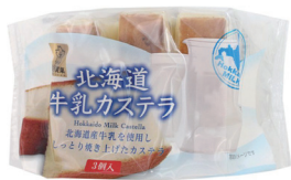
北海道牛乳カステラ