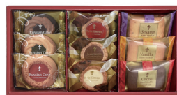
カフェスマイルセット