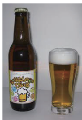
なかよしのびいる