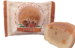
キャラメル(マロンタルト)