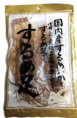
味わいするめあし