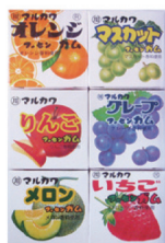
フルーツ6 マーブルガム