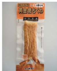
黄金焼ちくわ(カニ入)