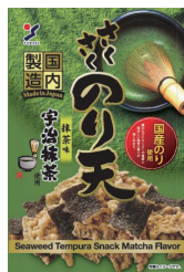
さくさくのり天 抹茶