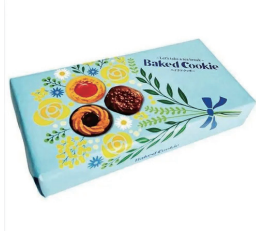
W バイクドクッキー