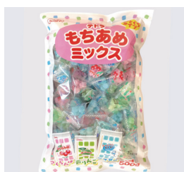
テトラもちあめミックス