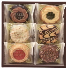
バイクドクッキー