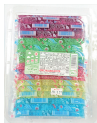
こんにゃくゼリー