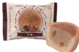
黒糖(マロンタルト)