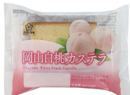
岡山白桃カステラ