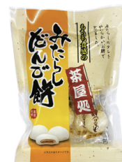
みたらしだんご餅