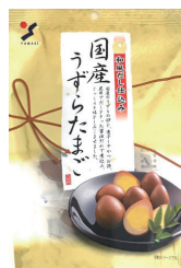
国産うずらたまご