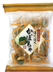
ほくほくかぼちゃ