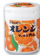
オレンジマーブルガムボトル