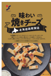
味わい焼きチーズ