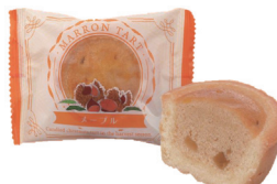
メープル(マロンタルト)