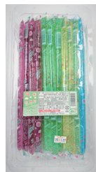
こんにゃくゼリー