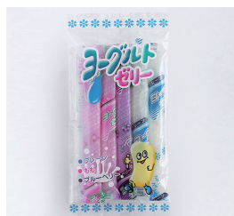
5本入ヨーグルトゼリー