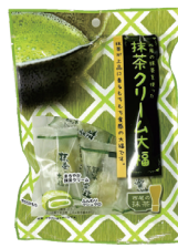
抹茶クリーム大福