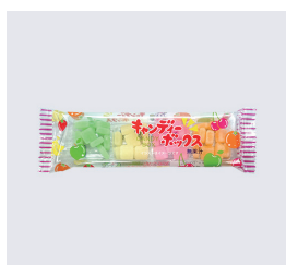
キャンディーボックス