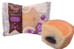
ヨーグルト&ブルーベリー