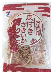
お徳用皮付きさきいか