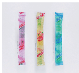
こんにゃくゼリー