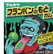
フランKンのもとガム