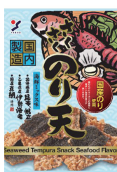
さくさくのり天 海鮮ミックス味