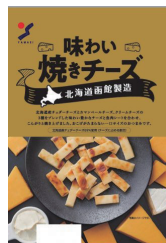
味わい焼きチーズ大袋