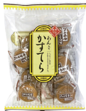
あん入りかすてら