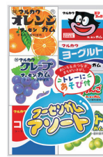
フーズンガムアソート