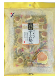
やわらかチーズ帆立