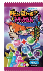
味が変わるトリックガム