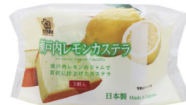
瀬戸内レモンカステラ