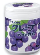
グレープマーブルガムボトル