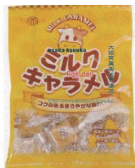
ミルクキャラメル