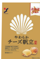
やわらかチーズ帆立