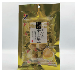
やわらかチーズ帆立