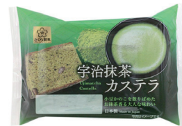
宇治抹茶カステラ