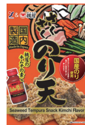
さくさくのり天 桃屋のキムチの 素味