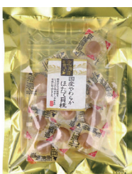
国産やわらかはたて貝柱