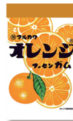
チャック袋オレンジフーセンガム