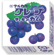
グレープフーセンガム