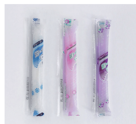
ヨーグルトゼリー