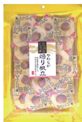
やわらか焙り帆立