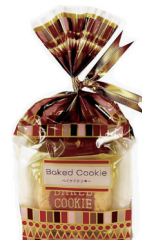
Kバイクドクッキー