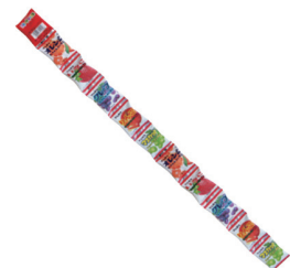
フルーツマーブルつりさげフーズンガム