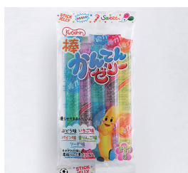
5本入棒かんでんゼリー