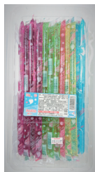
ジャンボネオンゼリー