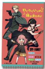
スパイファミリーガム