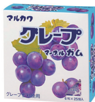
ビックサイズグレープマールガム