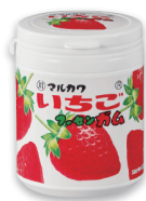
いちごマールガムボトル