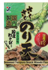
さくさくのり天 わさび味