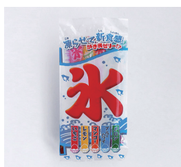
5本入かき氷ゼリー