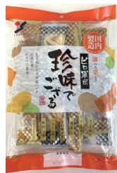
珍味でござる (オレンジ)