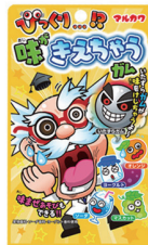
味がきえちゃう!? ガム