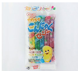
5本入こんにゃくゼリー