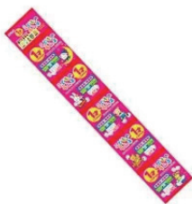
5連こどものラムネ