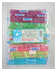
ジャンボネオンゼリー