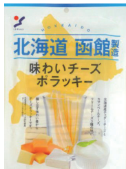
味わいチーズポラッキー