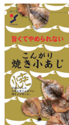
こんがり焼き小あじ