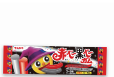
あかべ〜くろべ〜ガム