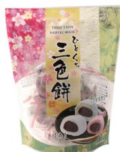
ひとつくち三色餅