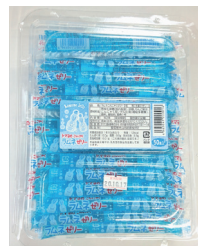
ラムネこんにゃくゼリー