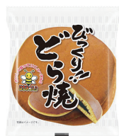
びっくりどら焼き