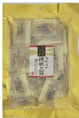
やわらか焼帆立貝