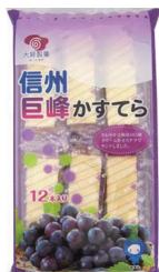
信州巨峰かすてら