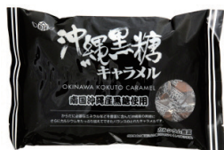
沖縄黒糖キャラメル