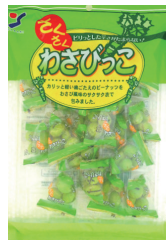
さくさくわさびっこ